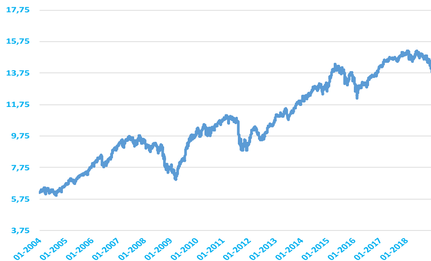
Adriza Neutral, FI Valor Liquidativo desde Inicio del Fondo